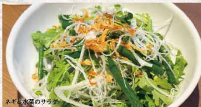
ネギと水菜のサラダ