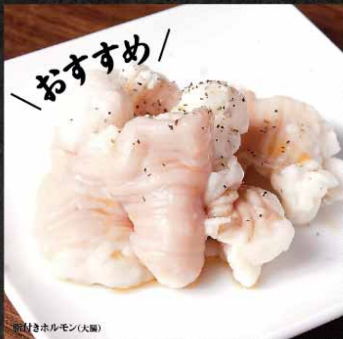
脂付きホルモン(大腸)