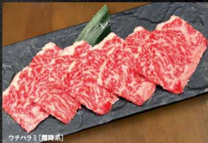
ウチハラミ[霜降系]