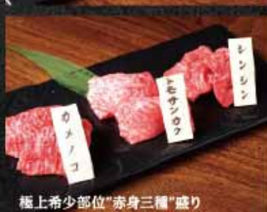
極上希少部位"赤身三種"盛り