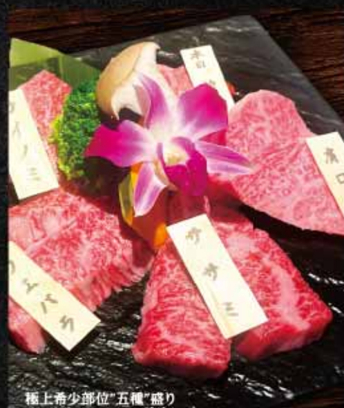
極上希少部位"五種"盛り