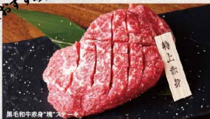
黒毛和牛赤身"塊"ステーキ