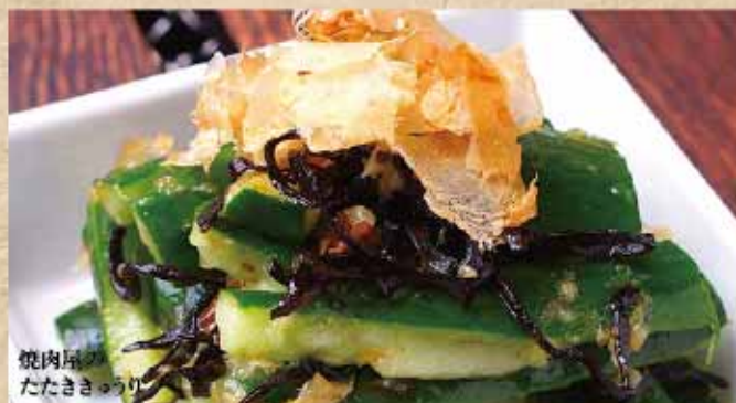
焼肉屋の たたききゅうり