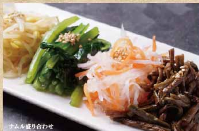
ナムル盛り合わせ