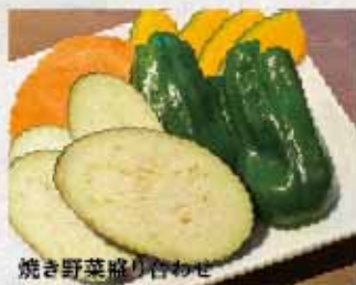
焼き野菜盛り合わせ