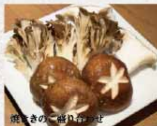
焼ききのこ盛り合わせ