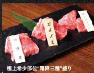
極上希少部位"霜降三種"盛り