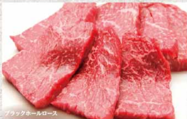
ブラックホールロース