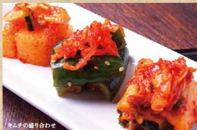
キムチの盛り合わせ