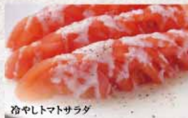
冷やしトマトサラダ