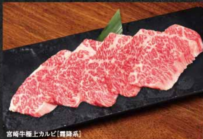
宮崎牛極上カルビ[霜降系]