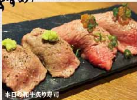
本日の和牛炙り寿司