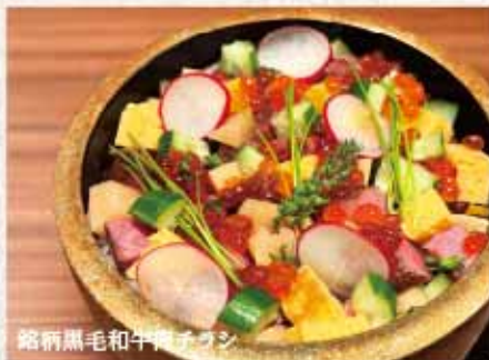
銘柄黒毛和牛肉チラシ