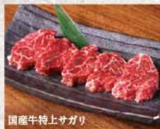
国産牛特上サガリ