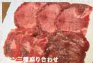
タン3種盛り合わせ