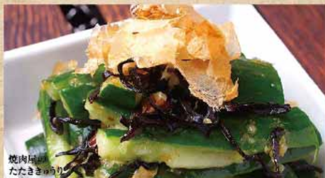
焼肉屋の たたききゅうり

チャンジャ 税込 350円 辛味と旨みのバランスが良い、おつまみに最適なメニューです。