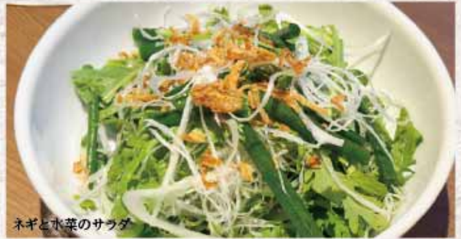
ネギと水菜のサラダ