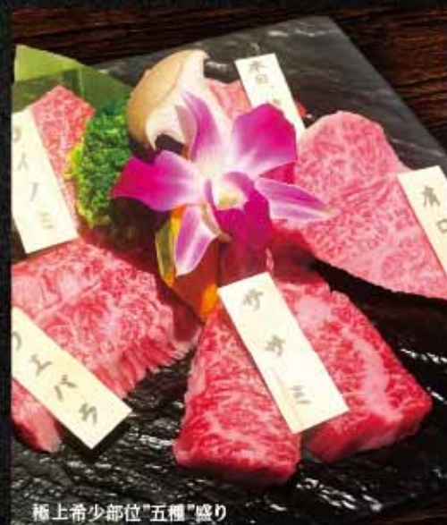
極上希少部位”五種”盛り