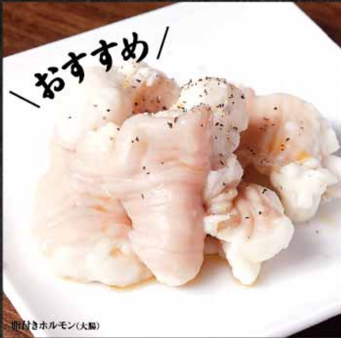
脂付きホルモン(大腸)