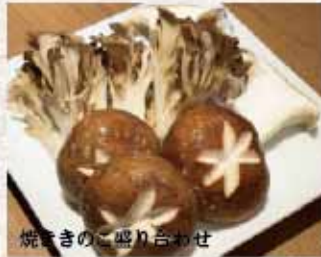
焼ききのこ盛り合わせ