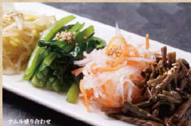
ナムル盛り合わせ