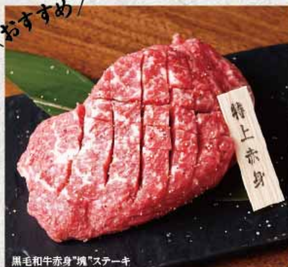
黒毛和牛赤身”塊”ステーキ