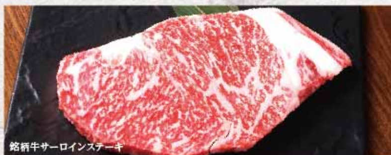
銘柄牛サーロインステーキ

黒毛和牛赤身”塊”ステーキ ..... 税込 2,800円 周りはこんがりとは中はレアで仕上げるのが最高です。