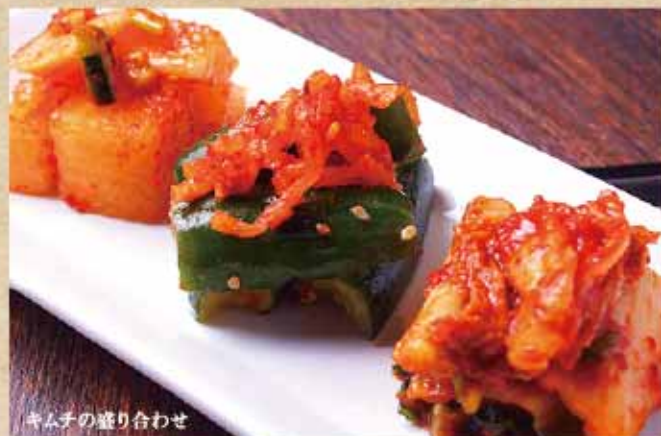
キムチの盛り合わせ

もやしナムル 税込 350円 白菜キムチ ナムル盛り合わせ 税込 600円 大根キムチ