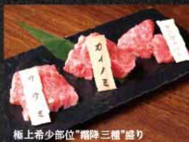
極上希少部位”霜降三種”盛り