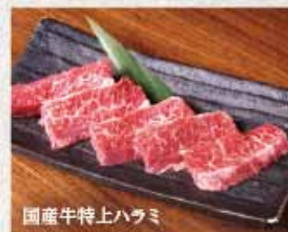
国産牛特上ハラミ