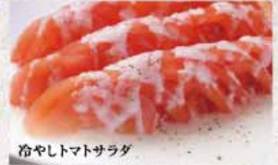
冷やしトマトサラダ