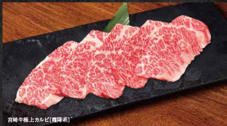
宮崎牛極上カルビ [霜降系]