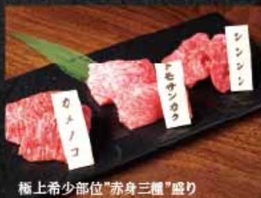
極上希少部位”赤身三種”盛り