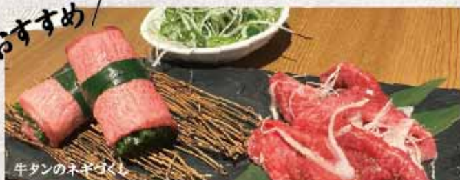
牛タンのネギづくし