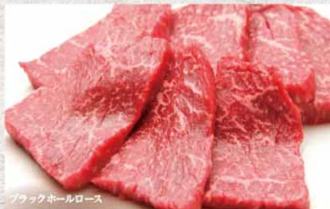
ブラックホールロース