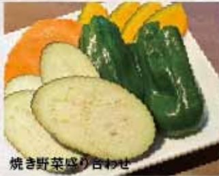
焼き野菜盛り合わせ